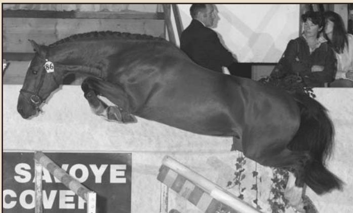
Avec ce style parfait, le bondissant Ziezo II a répété à chaque fois des sauts aussi spectaculaires que sur cette photo.

Tout de suite après Ziezo , en fin de soirée, c'est Zingaro qui a séduit la salle. Le fils de Berlin, a été acheté 57.000 €, le deuxième prix de la soirée, par la société Equidis , qui vient de reprendre le haras de Mesnil-Jean dans l'Orne.