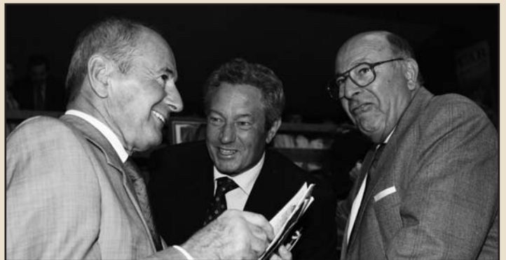
Trois associés heureux par une fin de soirée finalement très animée !