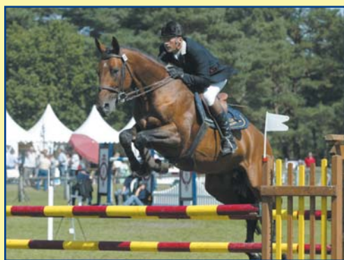
KRAQUE BOOM BOIS MARGOT (OLISCO)