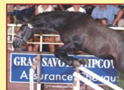
UNTOUCHABLE ALIA (QUICK STAR)