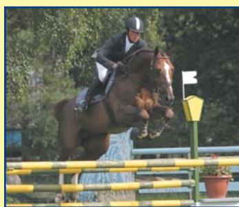
WATCH ME VAN'T ZORGVLIET (HEARTBREAKER)