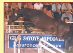
NOBL DE L'HERMITAGE (KANNAN)